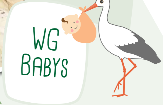
Berücksichtigt wurde der Zeitraum vom 01.09. bis 31.12.2020